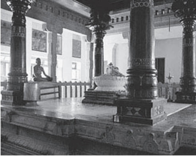
Starea de Mahasamadhi 1 a Maestrului