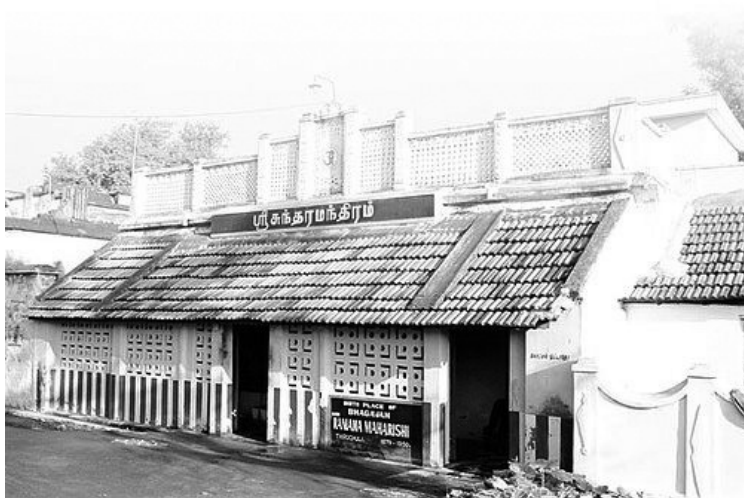
Casa natală din Tiruchuli