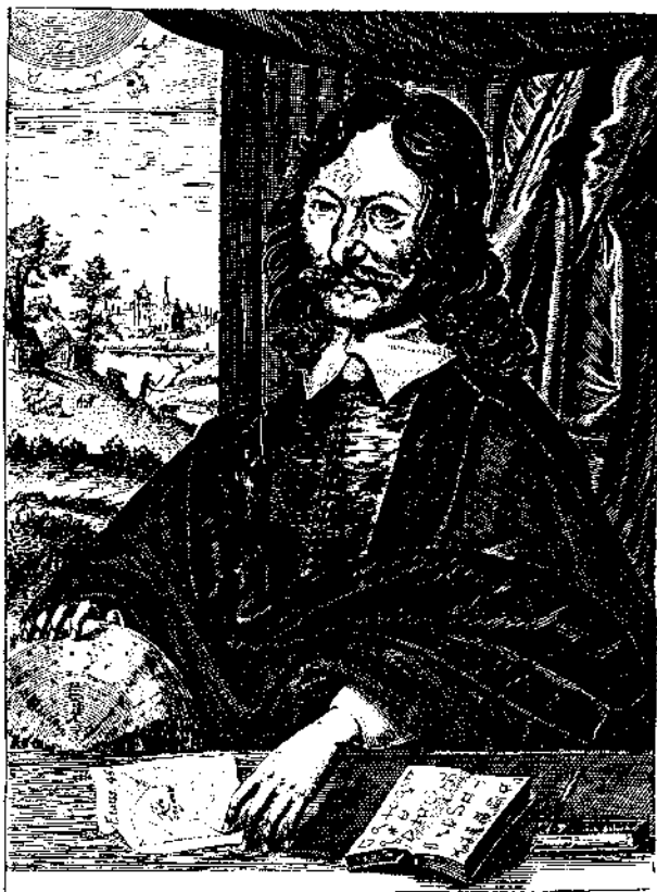
GULIELMUS LILLIUS Astrologus Natus Comital: Scicest: 1 o May 1602 .